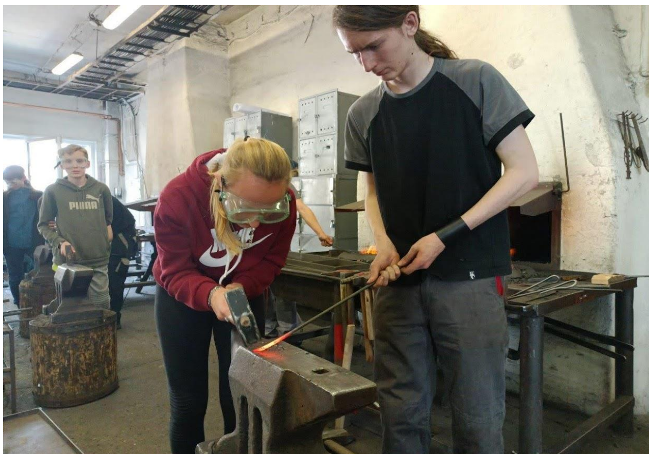
Projektové dny v SŠ Oselce pro žáky 8. ročníku jsou zaměřeny na praktické činnosti.

Každoroční finanční příspěvek, tentokrát ve výši 50 tis. Kč, od Nadání Josefa, Marie a Zdeňky Hlávkových přispívá k podpoře aktivit nadaných a talentovaných žáků a je využíván v oblasti nadstavbové činnosti - kroužcích, příspěvku na jazykové tábory a k podpoře nadaných sportovců.