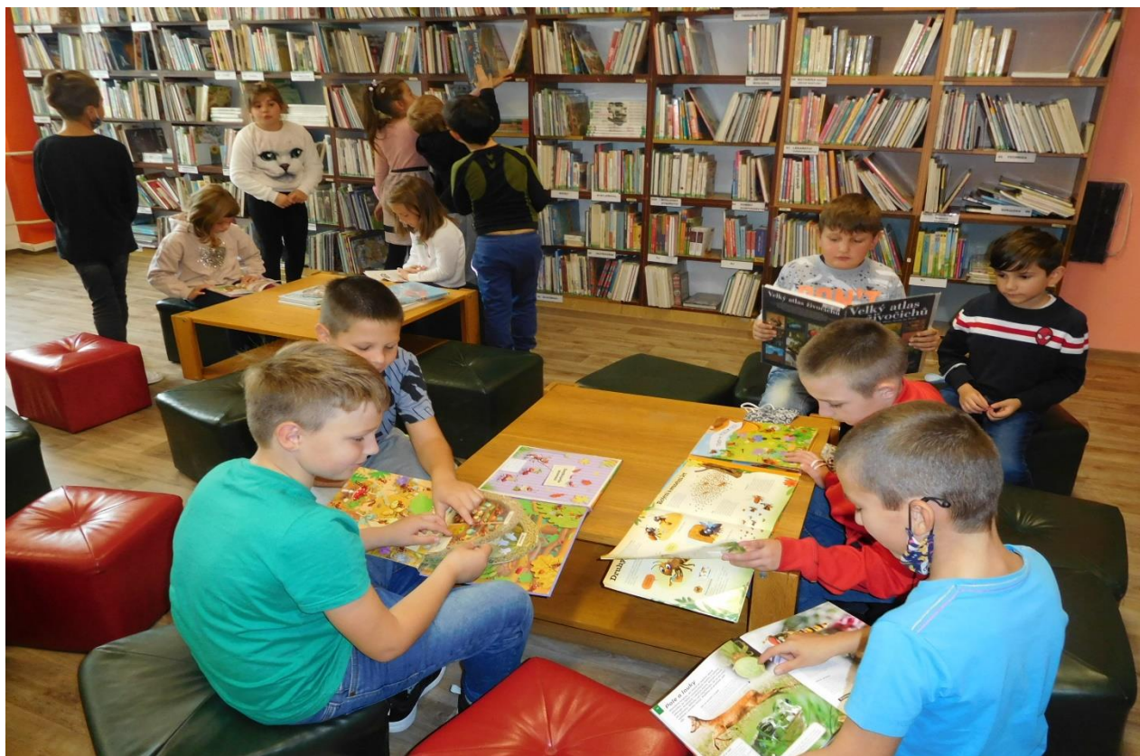
Pravidelnou spoluprací s Městskou knihovnou Přeštice dochází k prohlubování čtenářské gramotnosti. Na snímku žáci 2. ročníku.

Finanční výbor Města Přeštice kontroloval nakládání s prostředky zřizovatele, veřejné poptávky a jejich vyhodnocení. Výsledek kontroly byl bez závad s doporučením pokračovat v nastaveném trendu poptávek.