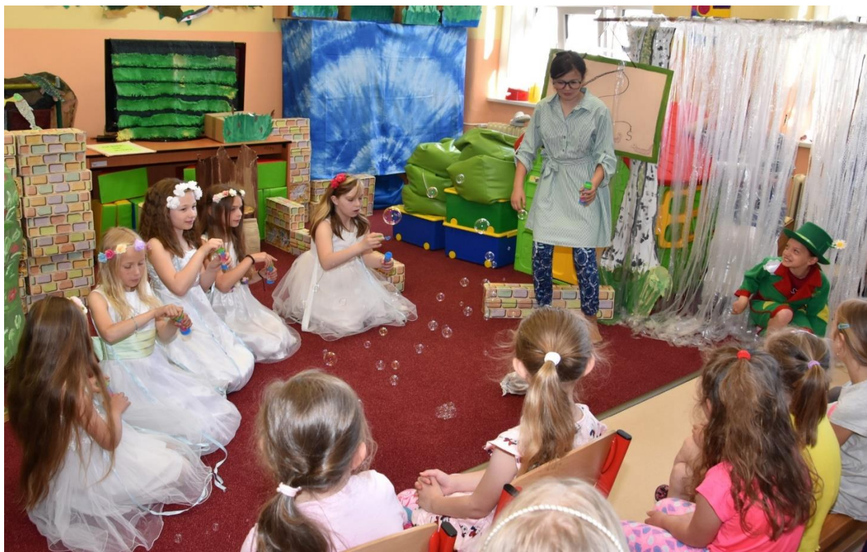
Představení „Hastrman a detektivové“ společně připravily Přestické flétničky a dramatický kroužek. Představení bylo odehráno jak spolužákům, tak i rodičům.

Aktivity a prezentace školy na veřejnosti byla ovlivněna epidemiologickou situací na začátku školního roku. Předpokládat vývoj situace v té době bylo velice složité, proto i plán akcí byl omezený. Některé plánované akce ke konci kalendářního roku byly přesunuty do dalšího období. I přes všechny obtíže se škola prezentovala na několika akcích. Velice úspěšné byly koncerty Skalky, Skaláčku a Přestických flétniček v květnu a červnu 2022, projektové dny se SOU Oselce či Gymnáziem Mikulášské náměstí Plzeň. I nadále pokračují kroužky anglického jazyka Cambridge, kdy v září byly za účasti rodičovské veřejnosti slavnostně předávány certifikáty.