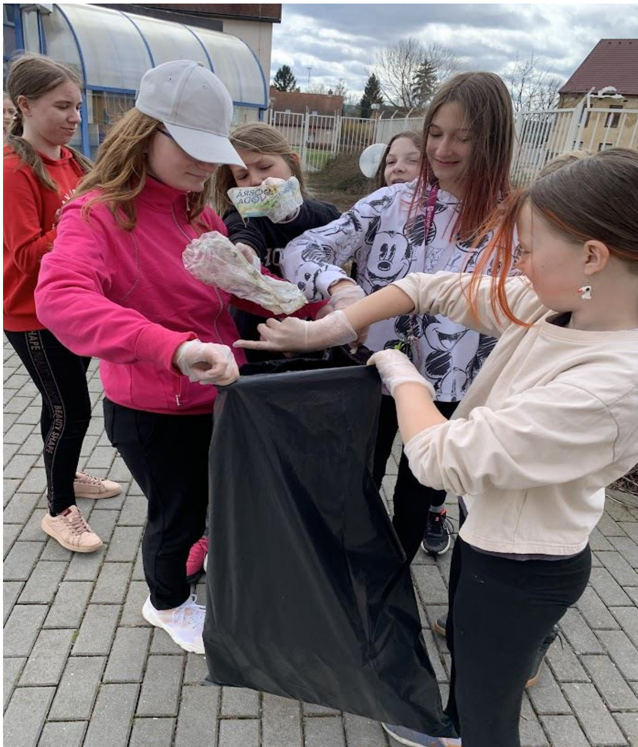
Uklidme Česko probíhá především v okolí školních budov a kolem řeky Úhlavy.