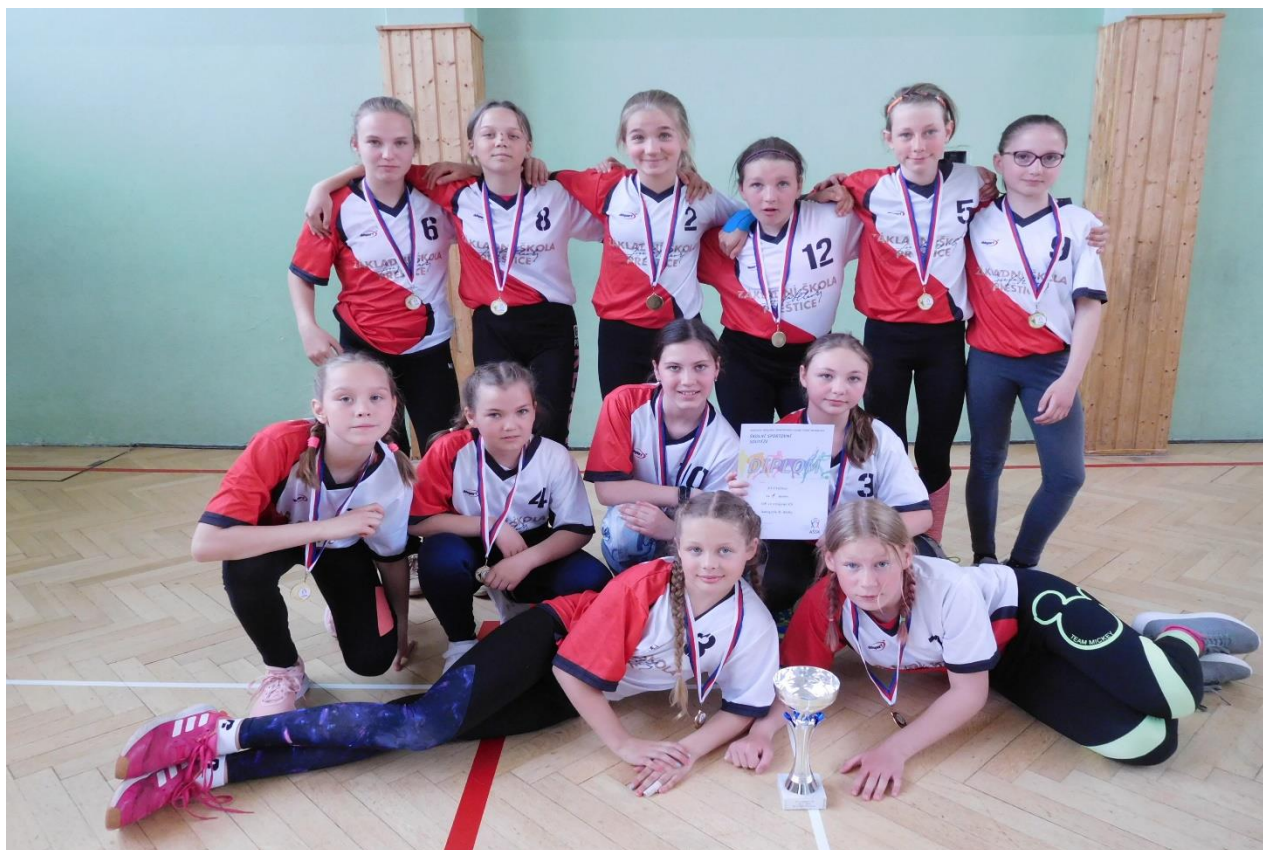
Na jaře se naplno rozběhly i sportovní soutěže. Na snímku vítězné družstvo dívek 5. ročník v okresním kole vybíjené.