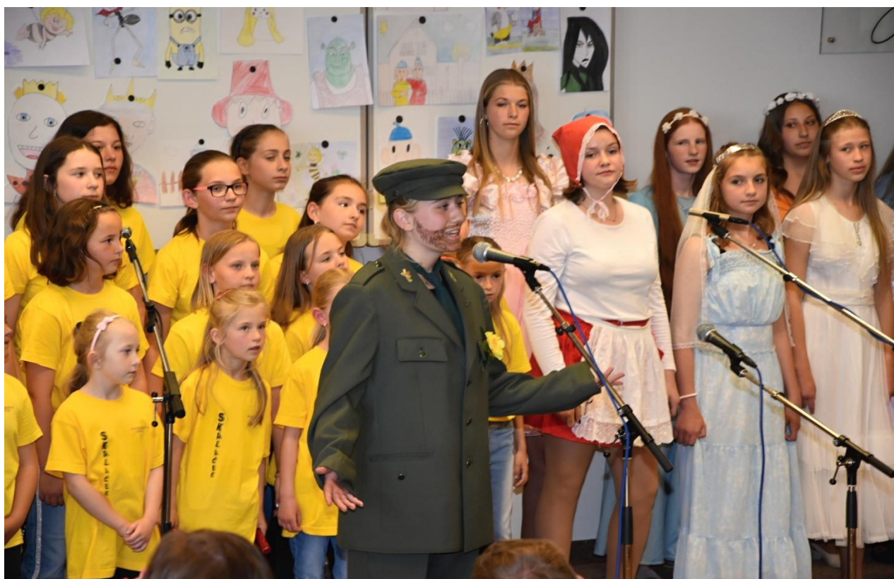
Na konci května a začátkem června proběhly koncerty našich sborů pod názvem „Přijíždí k nám Večerníček“