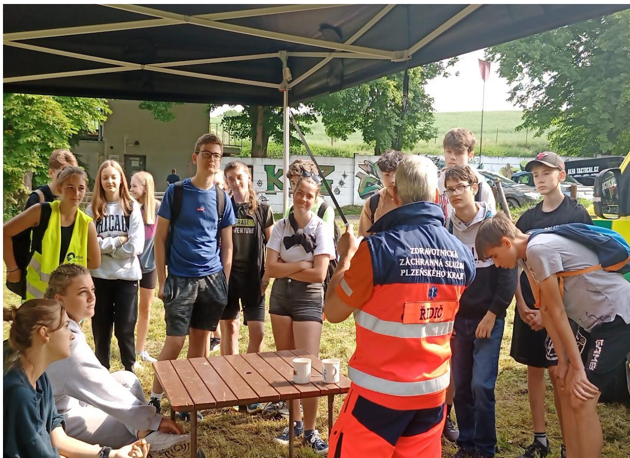
Součástí branného dne jsou i základy první pomoci či.....