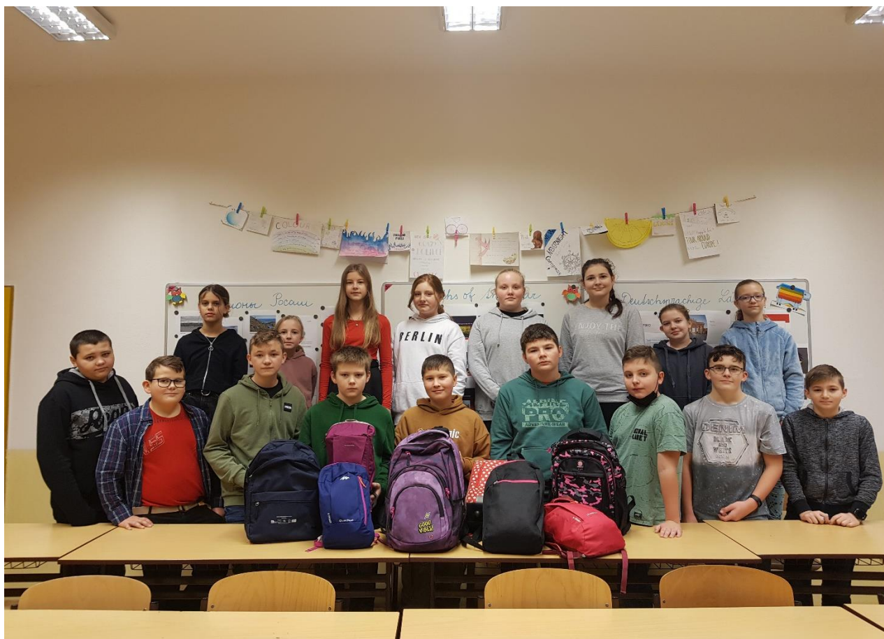
Žáci, kteří se účastnili „Batůžkového projektu“, který připravil školní pomůcky pro děti z Malawi.

V druhé polovině roku naopak slovinská škola iniciovala vytvoření anglicko-slovinsko-česko-ukrajinského obrázkového slovníčku. Společnými silami jsme tak napomohli lepší adaptaci našich ukrajinských spolužáků.