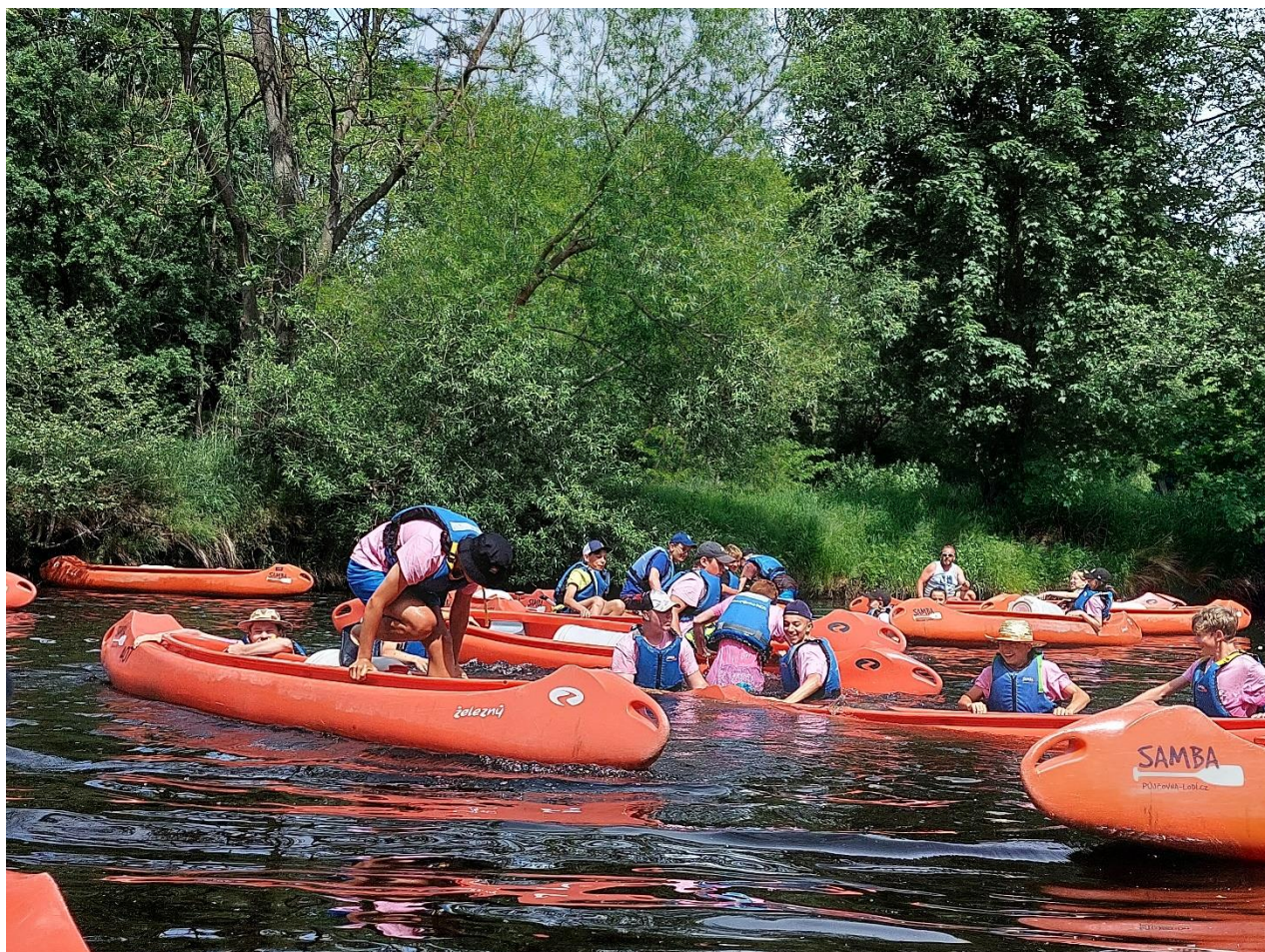
Vodáckému kurzu 8. ročníku na Otavě přálo počasí i dostatek vody.