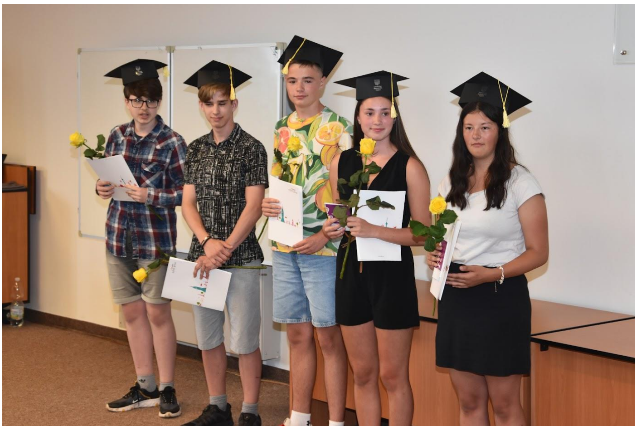
Žáci, kteří úspěšně složili zkoušku B1 Preliminary for Schools, při předávání osvědčení.

Nastavený systém rozšiřujícího vzdělávání v angličtině se osvědčil a již od 1. ročníku jsou stabilně obsazeny dvě skupiny max. po 18 žácích. O oblíbenosti přípravného kroužku svědčí i to, že se každoročně zkoušek na jednotlivých úrovních účastní více žáků.