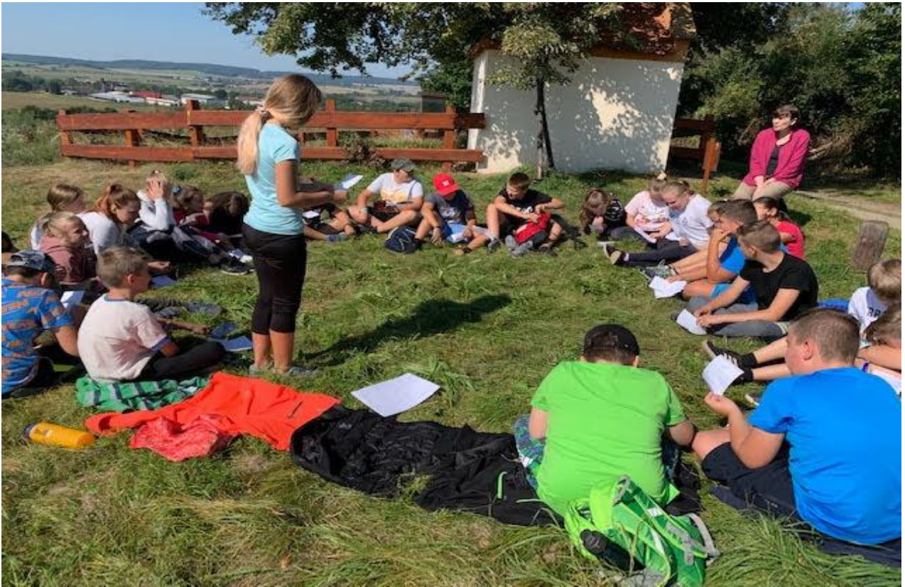
Adaptační kurzy pro 6. ročník patří k významným preventivním akcím.