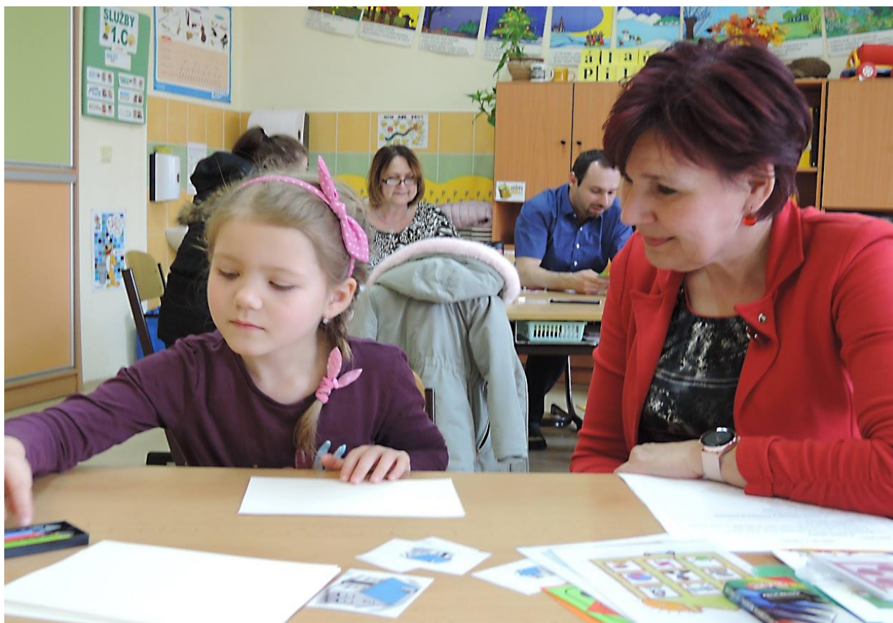
Zápis do 1. třídy proběhl po dvouleté přestávce „bez dětí“ opět za účasti budoucích školáků.