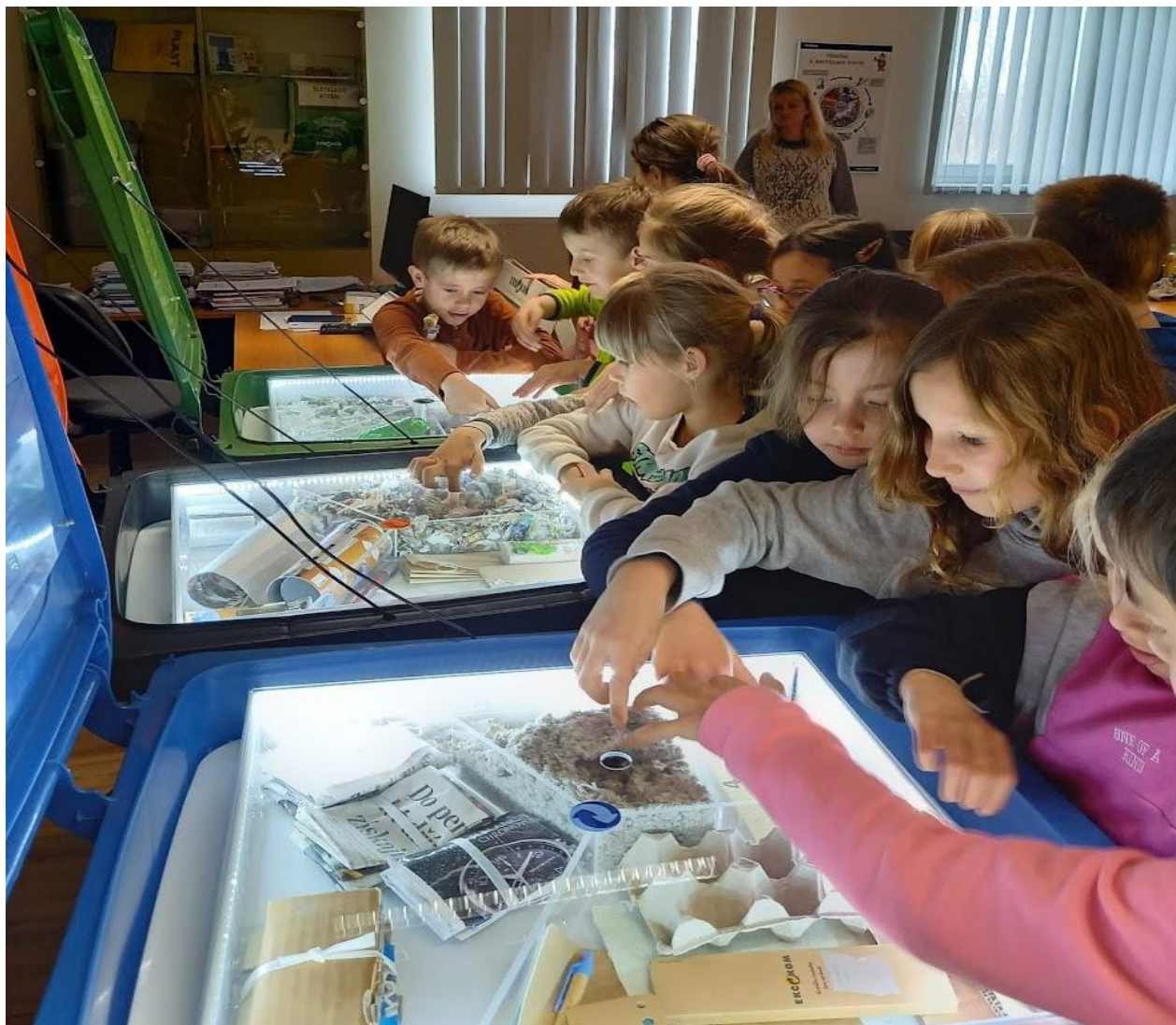
Den Země v Černošíně.

Den Země v Černošíně - v rámci Dne Země navštívili žáci školní družiny areál skládky Ekodepon v Černošíně. Měli zde možnost poznat smysl sběru a třídění odpadu, vznik bioodpadu a jeho využití. Prohlédli si areál, kde se třídí plasty a seznámili se s výrobky, které se z nich vyrábí. Všichni odcházeli s pocitem, že třídít odpad je užitečné a vyplatí se.