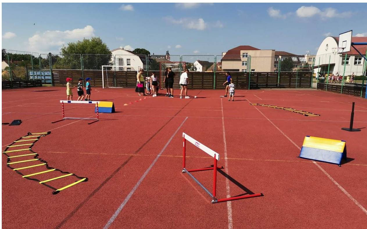
Naše škola pořádá každoročně sportovní den pro přeštické a okolní mateřské školy.