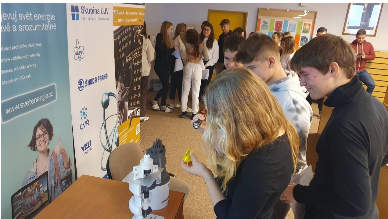
Pro žáky 9. ročníku je pravidelně pořádána beseda „Energie-budoucnost lidstva“