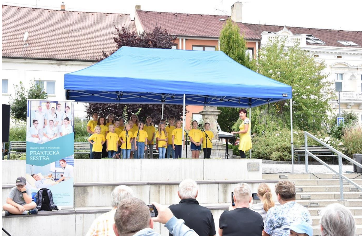
Pěvecký sbor Skaláček podpořil svým vystoupením "Den sociálních služeb" na Masarykově náměstí v Přešticích.