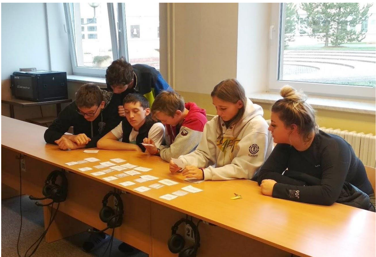
...a navazuje Preventivní program neplánované těhotenství na 2. stupni