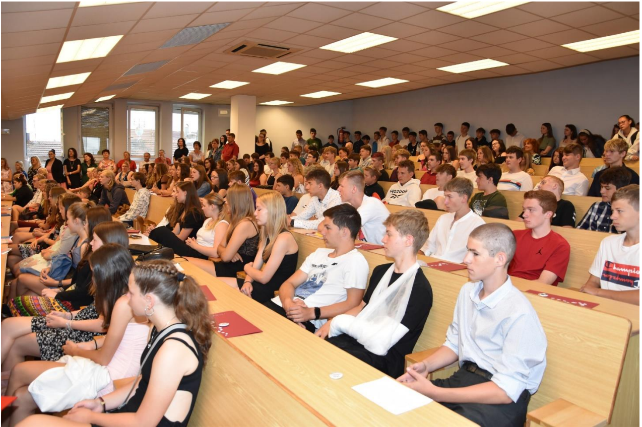
Slavnostní rozloučení s 9. ročníkem proběhlo netradičně v aule.