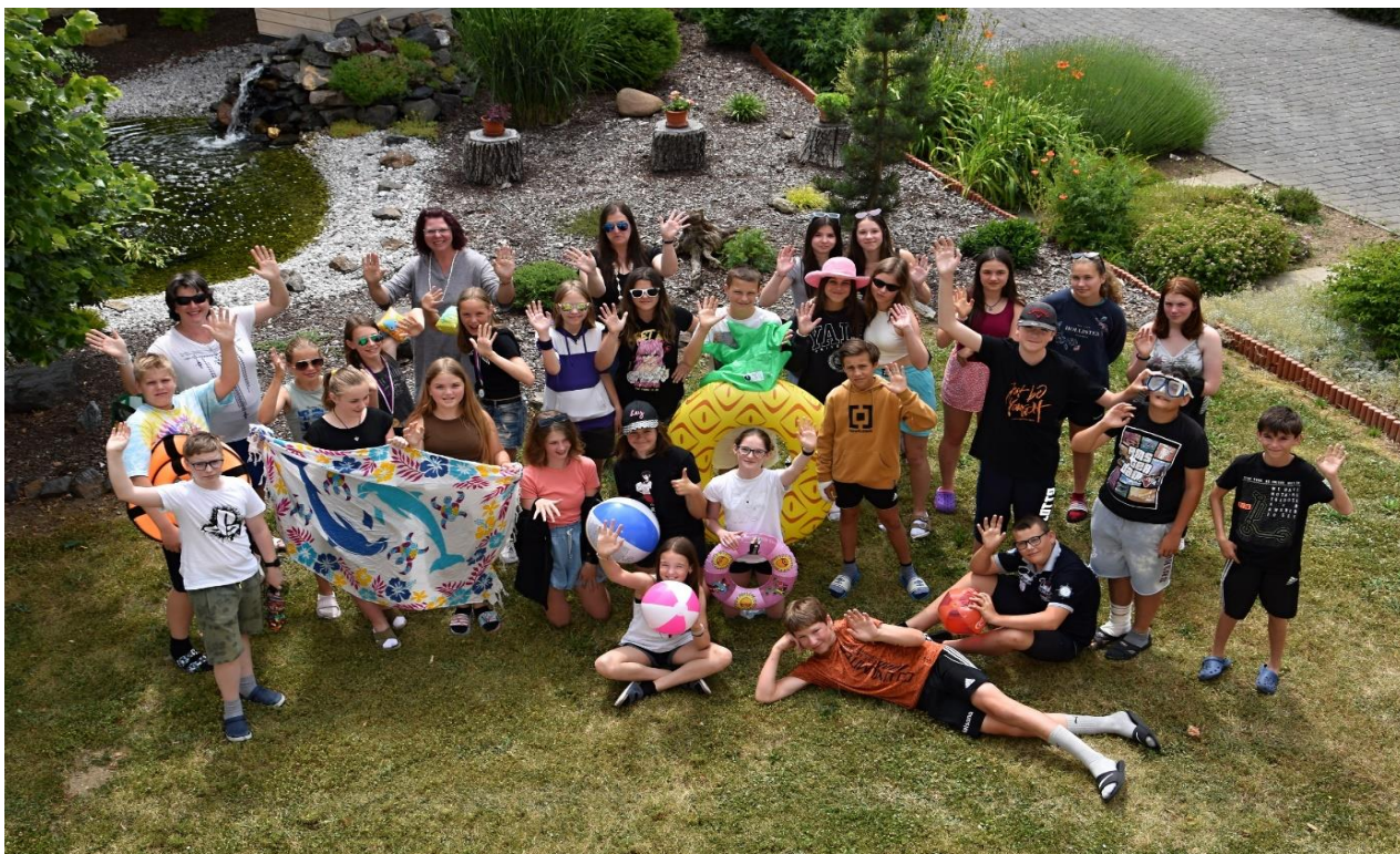
Pozdrav našich žáků na prázdniny do Krška.....

Po uklidnění pandemické situace v Evropě se opět naplno rozběhl projekt spolupráce se slovinskou školou v Kršku. Veškeré aktivity byly směřovány k přípravě vzájemného výměnného pobytu, který se uskuteční ve školní roce 2023/2024, kdy na jaře přijedou žáci a učitelé zapojeni do projektu vzájemné spolupráce na několikadenní návštěvu do naší školy.