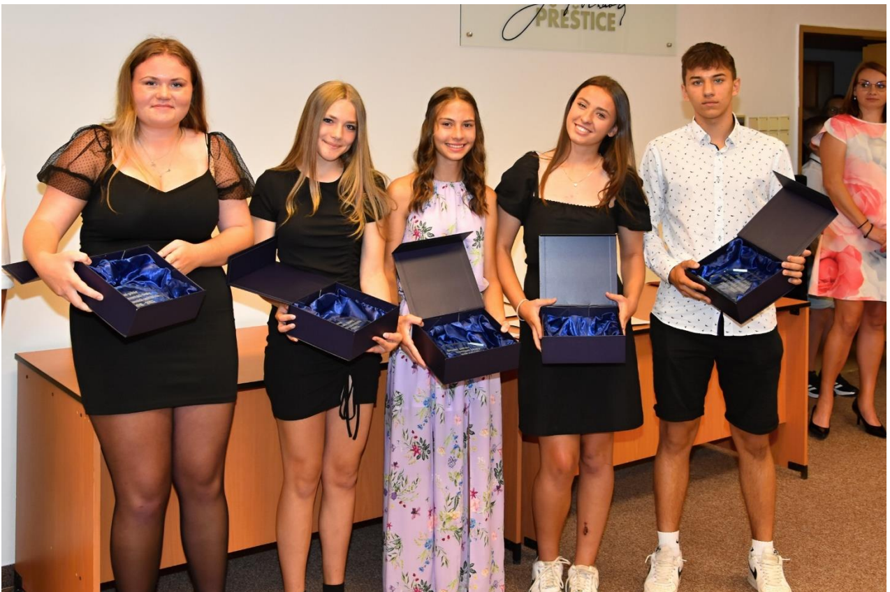
Součástí vyhlášení nejlepších žáků 9. ročníku je i předání Školního poháru za výbornou reprezentaci školy ve sportovních soutěžích.