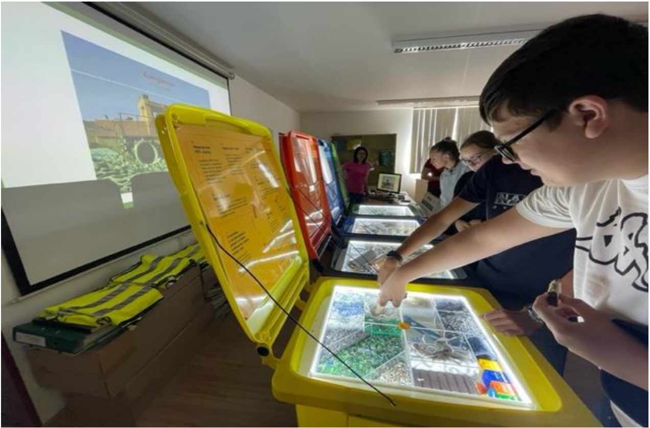
Enviromentální program pro 2. stupeň v EKODEPONu v Černošíně