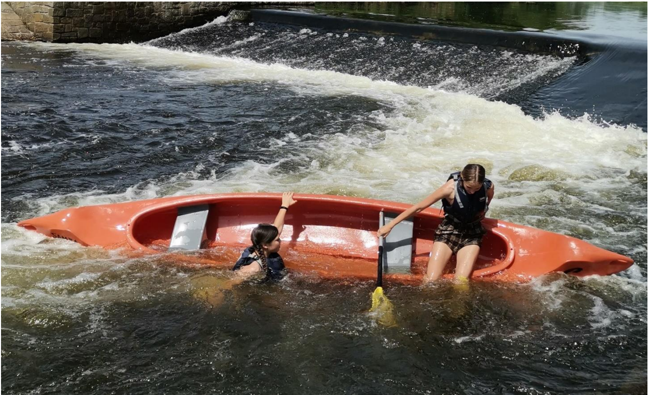
Mezi oblíbené akce patří vodácký kurz pro osmý ročník a lyžařské kurzy pro sedmý ročník.