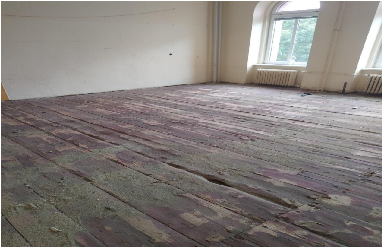
Původní podlahy v rekonstruovaných třídách v Rebcově ulici