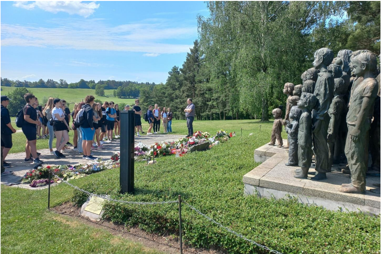
Exkurzí do Lidic a do Terezína si žáci 9. ročníku připomněli tragické období našich dějin