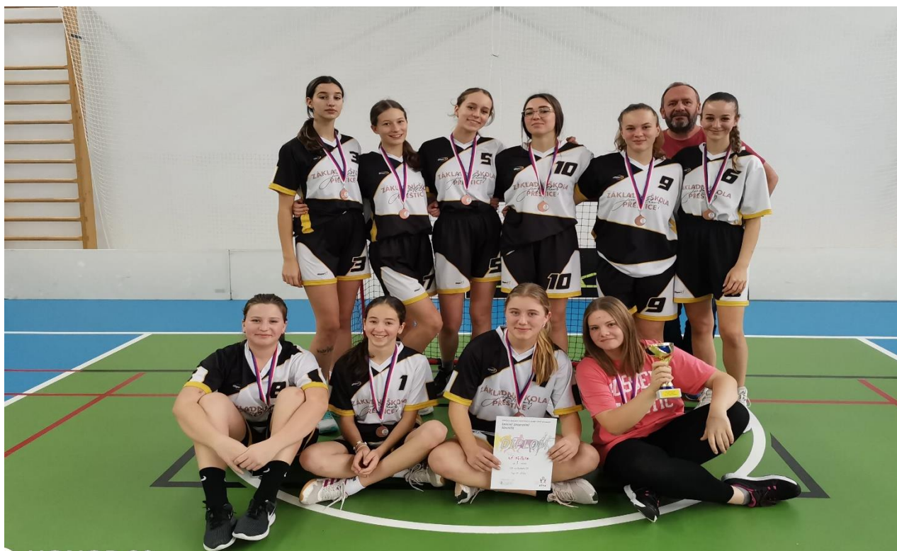
Florbald je velice oblíbenou hrou na 1. i 2. st. Okresní kolo st. dívky 3. místo.