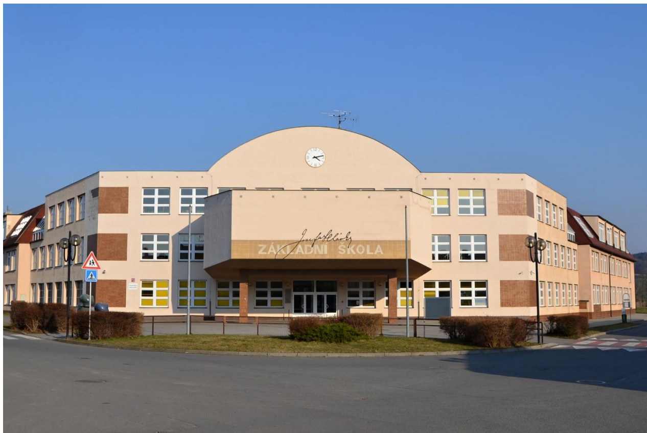
Hlavní vstup do budovy Na Jordáně tak, jaký byl od slavnostního otevření školy v roce 1996 až do roku 2023.