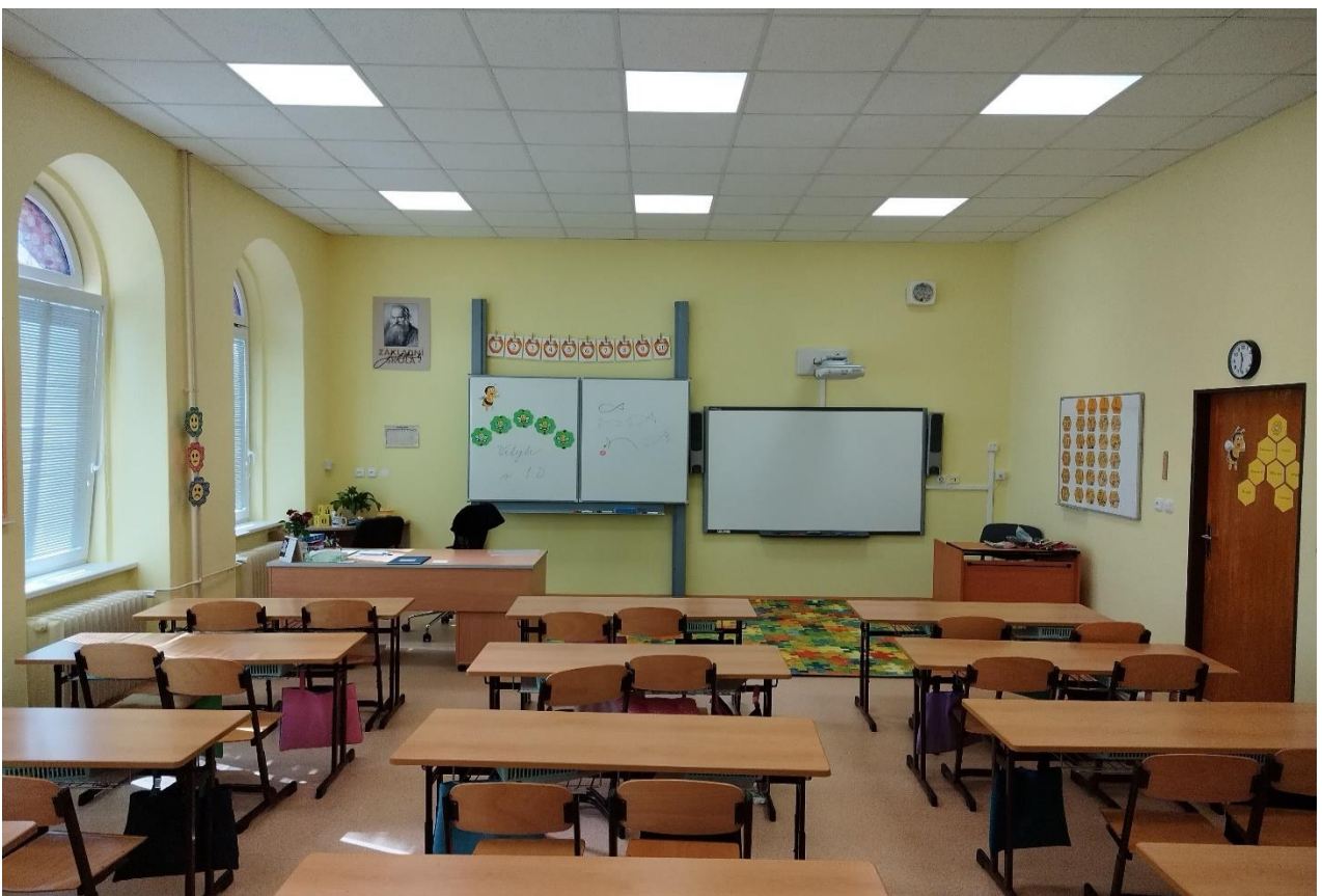
Zrekonstruovaná třída včetně nového úsporného osvětlení.