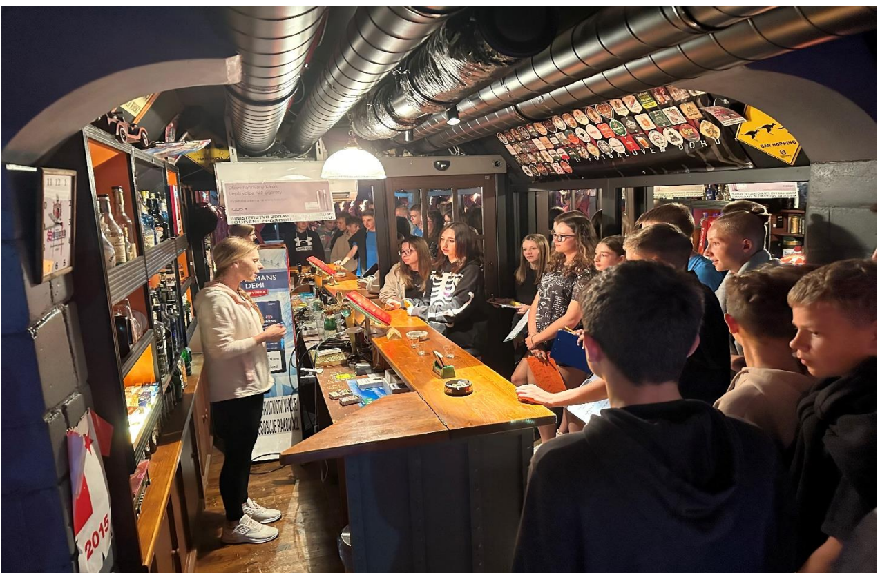
Revolution train je zaměřen na poukázání nebezpečí závislosti nejenom pro mladistvé