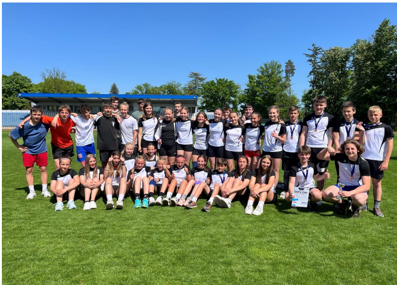
Výrazný úspěch dosáhla družstva ve všech kategoriích v atletické soutěži Pohár rozhlasu. V krajského finále v Domažlicích obsadila družstva ml. žáků 3. místo, ml. začek 4. místo, st. žáků 5. místo a st. dívek 6. místo.