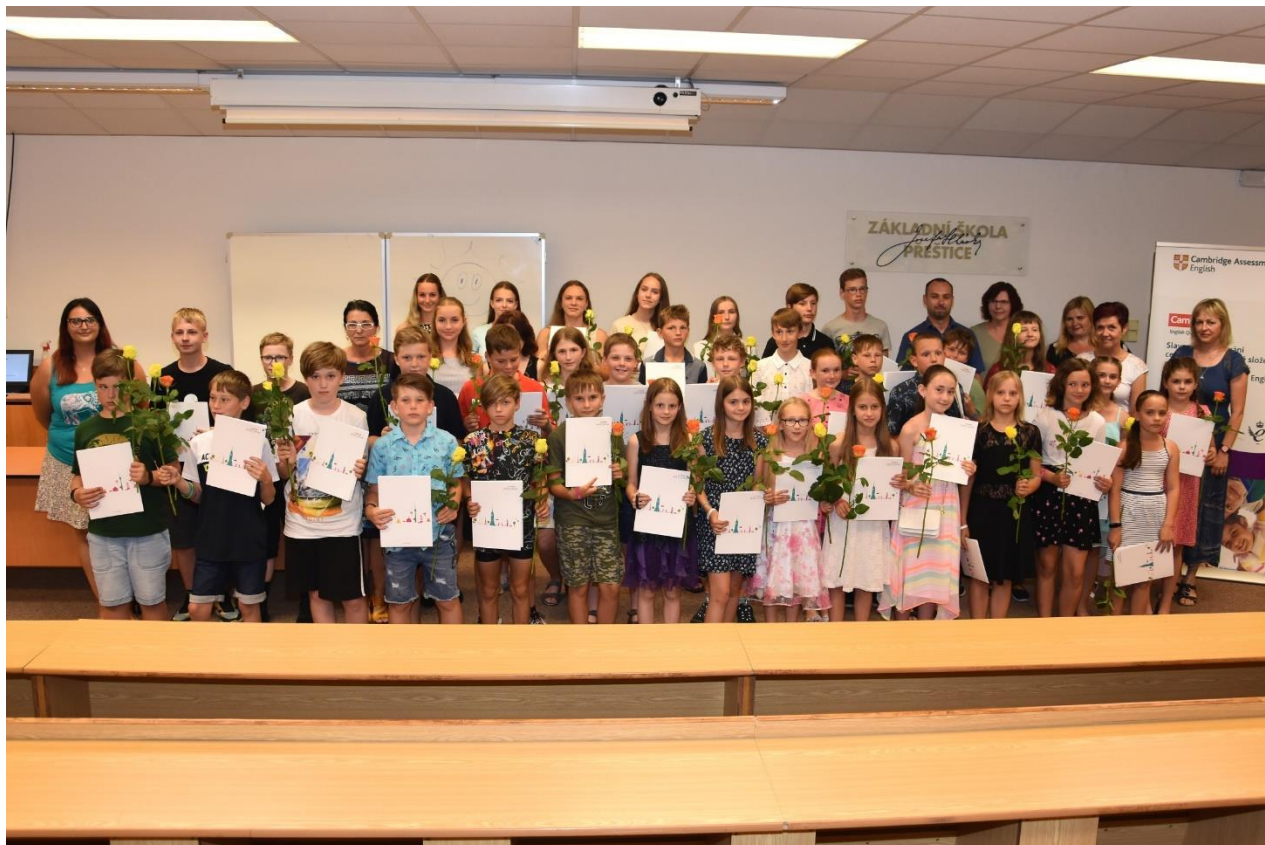
Slavnostní předání certifikátů proběhlo pro všechny žáky z různých úrovní splnění zkoušek

Nastavený systém rozšiřujícího vzdělávání v angličtině se osvědčil a vzhledem ke vzrůstajícímu zájmu musela být od 1. ročníku angličtina rozšířena o jednu skupinu. Další připravovanou změnou vedoucí ke zkvalitnění celého procesu bude nabídka rozšířena i pro žáky šestého ročníku.