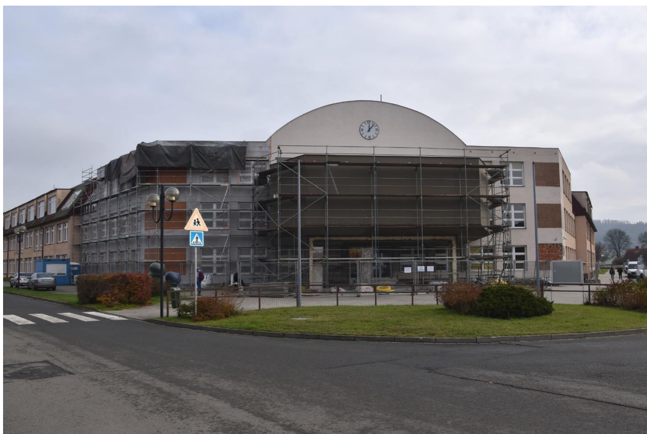
Pod lešením skrytý vchod do budovy a vstupní křídla, která byla opravována v první etapě.