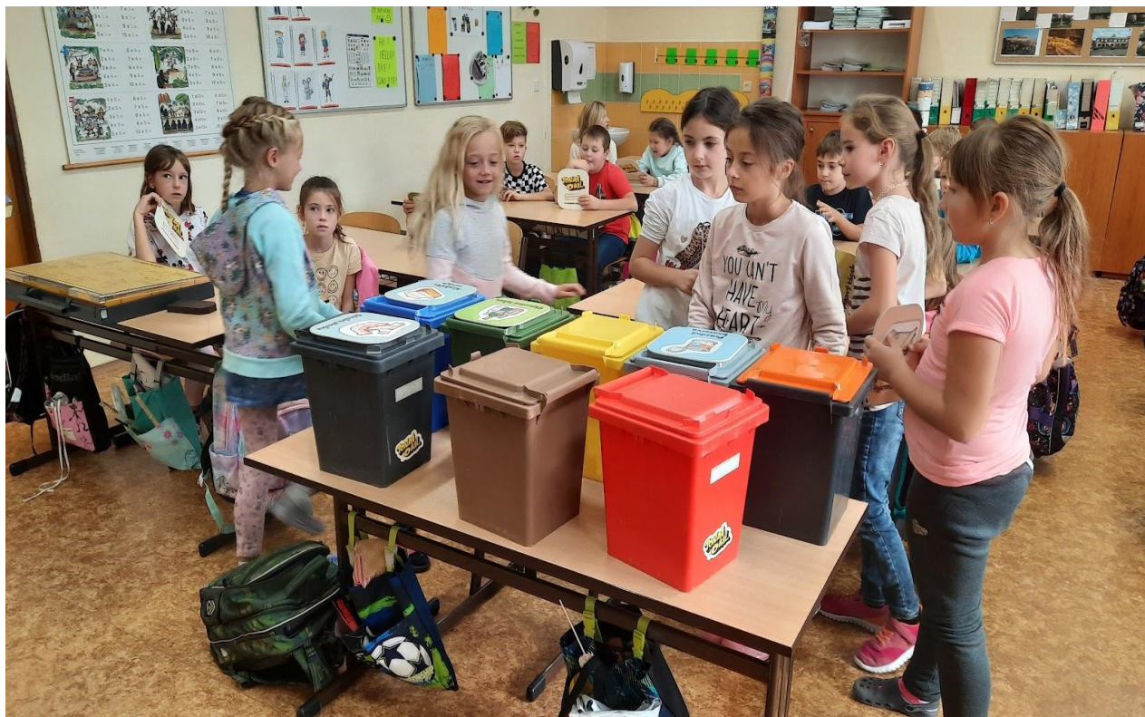
Environmentální program „Tonda Obal na cestách“

Mezi oblíbené environmentální programy se řadí i „Tonda Obal na cestách“, který seznamuje žáky 1. stupně s významem třídění odpadů, dopadem na přírodní zdroje a ekologii. Akce tohoto typu jsou vždy organizovány pro celý ročník případně i pro více ročníků. Tento environmentální program byl organizován pro 2. až 5. ročník.