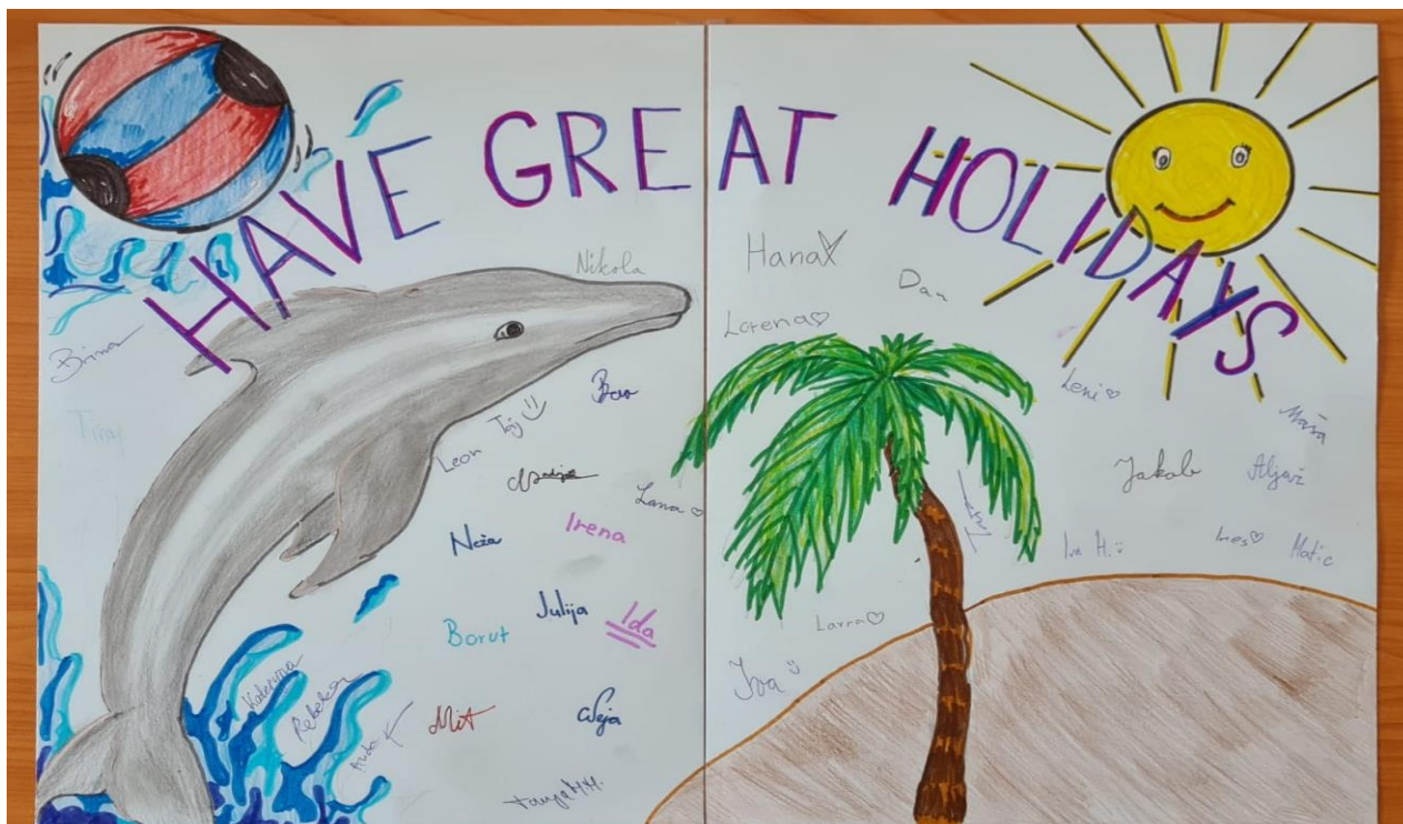
.....a žáků z Krška jejich kamarádům