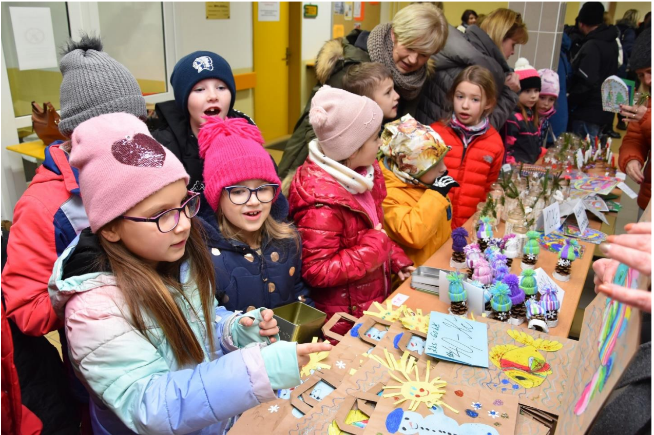
Vánoční jarmark 14. 12. 2022 probíhal jak v budově školy Na Jordáně, .....