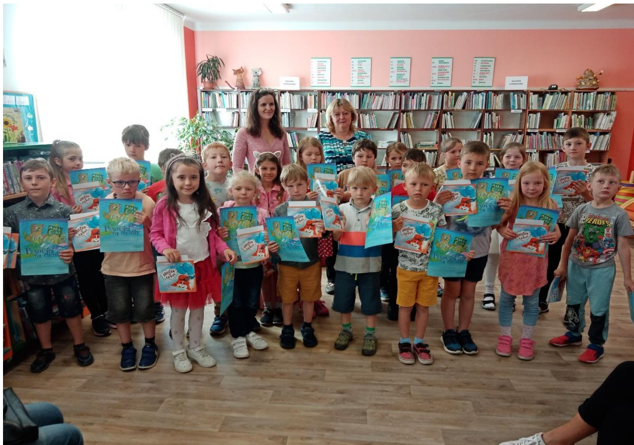
Pasování na čtenáře žáků 1. ročníku v Městské knihovně v Přešticích.